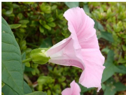
花はラッパみたいな形。