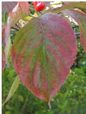
たまご 卵のような形の葉っぱ。 秋は濃い赤色に変わるよ。