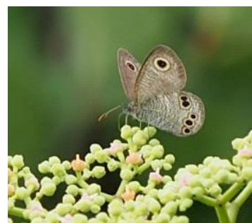
ヒメウラナミジャノメ