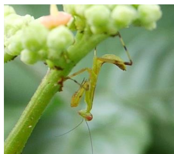
ミツをもとめてやってきた虫をねらうカマキリの子ども